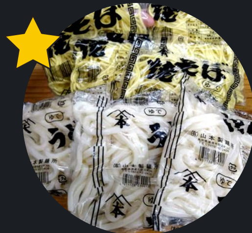
焼そばの麺,ゆでうどん 70円