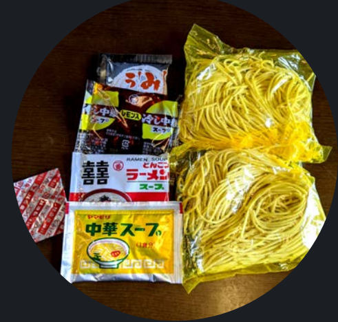
タピオカラーメン 2食入り 250円