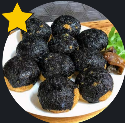
岩のりおにぎり 2個350円