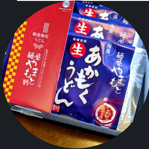
アカモクうどん 200円