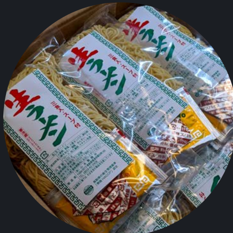
生ラーメン3食入り 300円