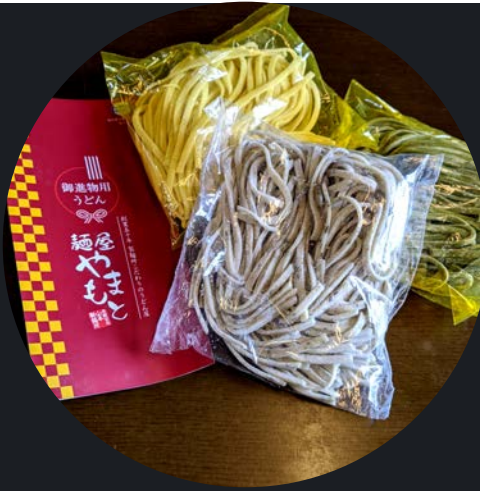
生うどん,オリジナル麺各種 モロヘイヤ,トマト,唐辛子 100円