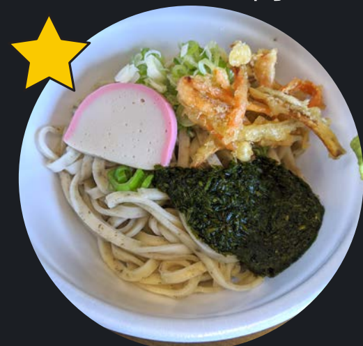
アカモクづくし650円